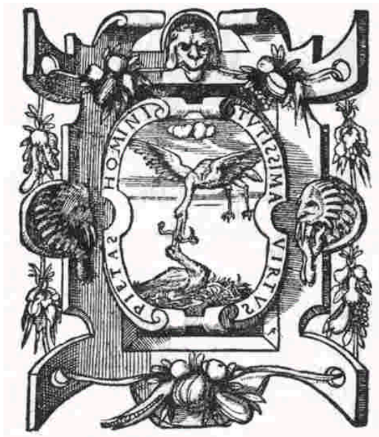
Marca del impresor Martin Nucio Amberes, 1556